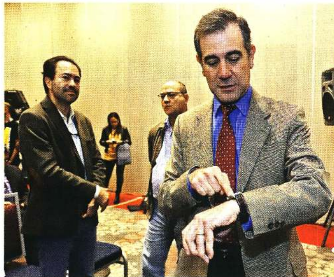
El consejero presidente del INE, Lorenzo Córdova, ayer en Guadalajara en un foro de la FIL.

Germán Martínez Senador del Grupo Plural