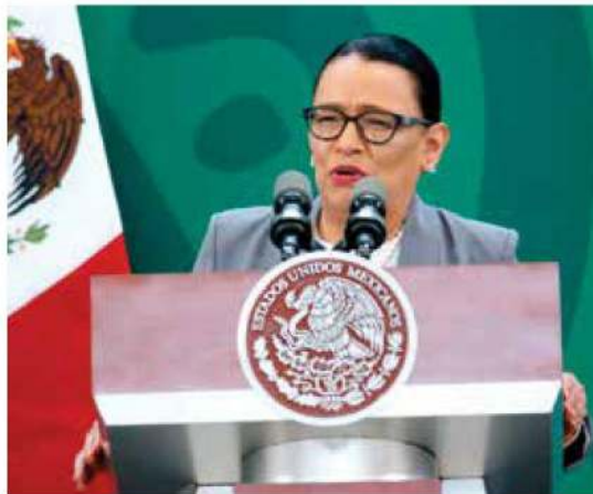
• BALANCE. Rosa Icela Rodríguez, ayer, durante la conferencia matutina en Veracruz.