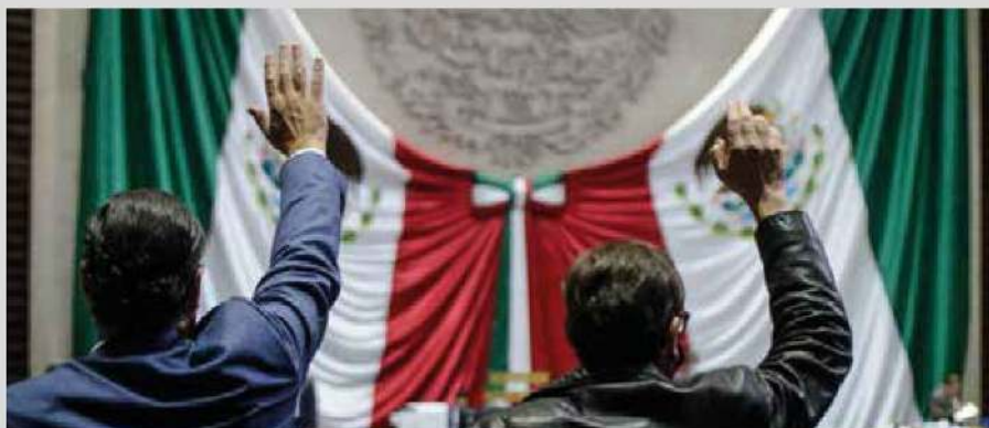
Morena pasó al Plan B de modificar leyes secundarias electorales.