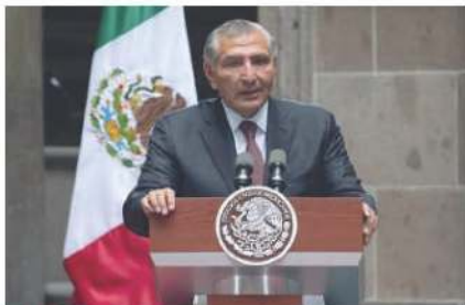
Adán Augusto López Hernández, secretario de Gobernación.