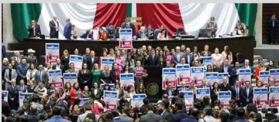
La sesión de la Cámara de Diputados, del martes pasado.