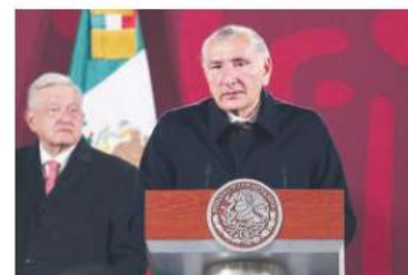
Adán Augusto López se dijo pues- to para participar.

Finalmente, ante la petición de Marcelo Ebrard de que se defina cuándo es que deben renunciar a sus cargos quienes quieran participar por la candidatura presidencial, el presidente Andrés Manuel López Obrador señaló que se deberá seguir lo establecido en el artículo 82 constitucional. ■