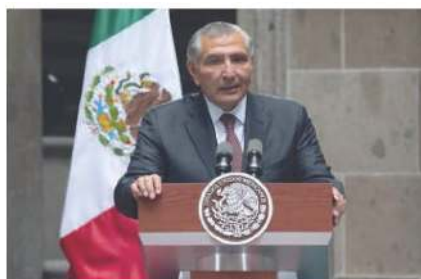
Adán Augusto López Hernández, secretario de Gobernación.

que deben renunciar a sus cargos quienes quieran participar por la candidatura presidencial, el presidente Andrés Manuel López Obrador señaló que se deberá seguir lo establecido en el artículo 82 constitucional. ■