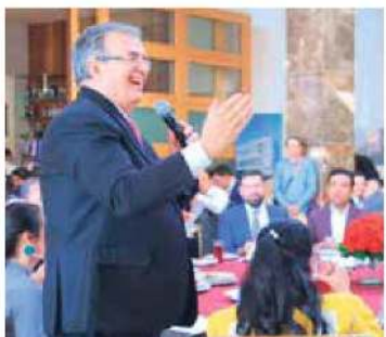
GIRA. El canciller Marcelo Ebrard, ayer, en Querétaro.