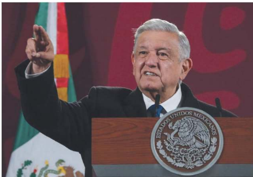
El presidente señaló que envió la iniciativa por un asunto de principios.