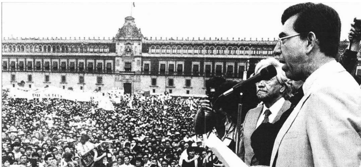
Cuauhtémoc Cárdenas , en 1988, se convirtió en un candidato con un gran impacto entre la ciudadanía.