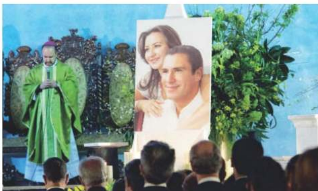
Moreno Valle y Erika Alonso murieron en un accidente de helicóptero el 24 de diciembre de 2018.