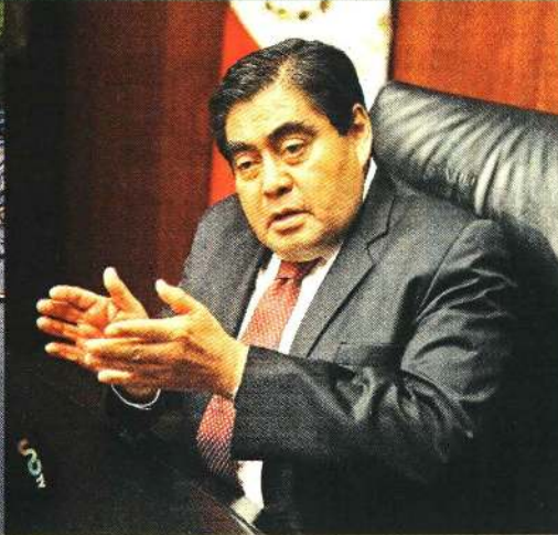
■ En la Cámara alta en octubre de 2017, ya como senador de Morena.