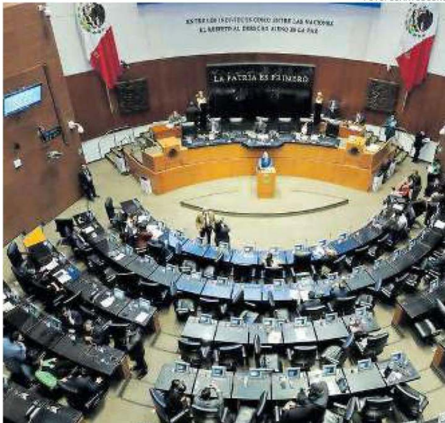
Van por el Plan B, hoy en el Senado.