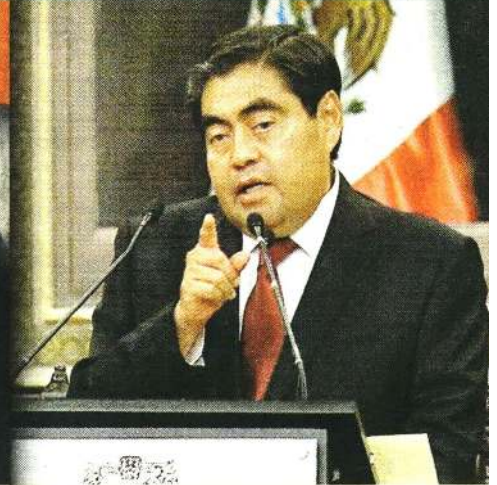
■ El 1 de agosto de 2019 rindió protesta como Gobernador de Puebla.