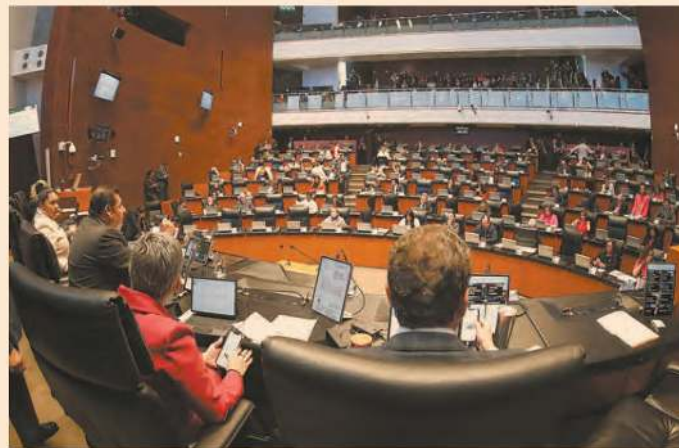
El pleno de la Cámara alta aprobó, en lo general por 69 votos a favor y 53 en contra, los cambios en materia electoral.

El tras- paso de votos, con lo que los partidos que no ob- tengan el 3% mínimo conserva- rán el re- gistro, es algo de lo que habría quedado en firme debido a que en San Lázaro se votó el pro- yecto en el mismo sentido.