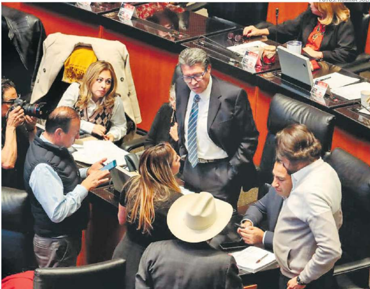
Ricardo Monreal señaló inconsistencias constitucionales en la iniciativa del Presidente