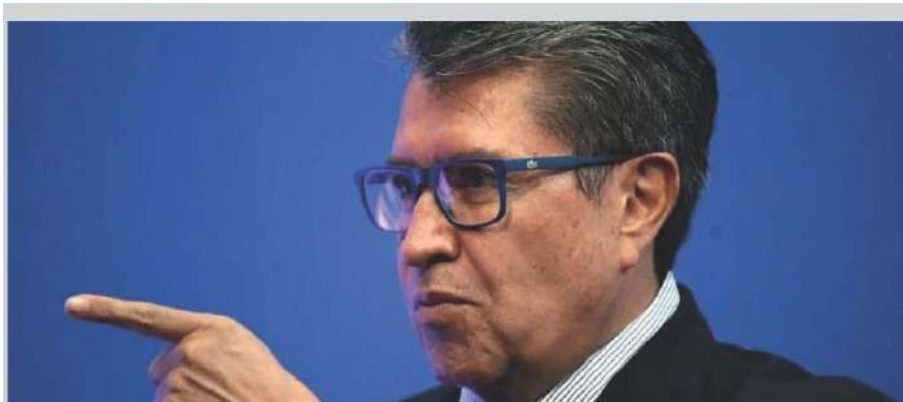
Ricardo Monreal Avila, sin fuerza política real, lo dejaron casi solo en el Senado.