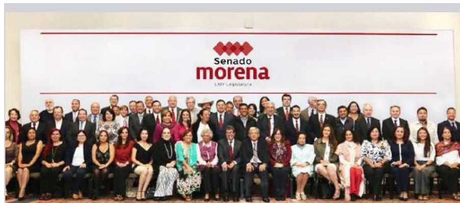
Los senadores de Morena refrendaron su lealtad a López Obrador.