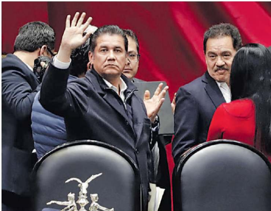
El coordinador de los diputados del Partido Verde, Carlos Puente