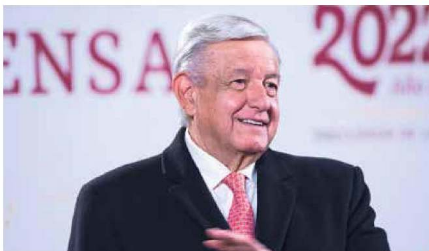
ANÁLISIS. El presidente Andrés Manuel López Obrador, ayer, en conferencia.