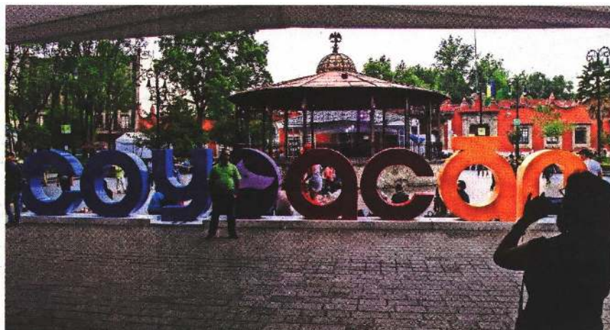
Coyoacán es hasta ahora la alcaldía que reporta más sanciones a funcionarios, con 51 casos donde hubo amonestación, suspensión e inhabilitación y penalización económica.

*El Órgano Interno de Control en Álvaro Obregón no reportó sanción.