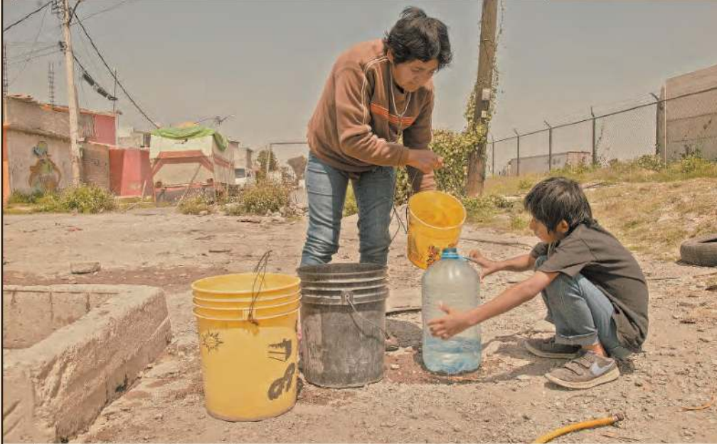
Habitantes de zonas marginadas ocupan las tomas ilegales para también abastecerse.

• En algunas zonas de México el agua se ha vuelto tan escasa que se contrabandea con ella. Los huachicoleros la roban de pozos y tuberías públicas, aprovechando la falta de vigilancia de las autoridades. El negocio ilícito es cada vez más rentable a medida que las sequías y los problemas de la infraestructura crecen