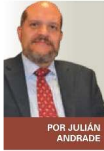
POR JULIÁN ANDRADE