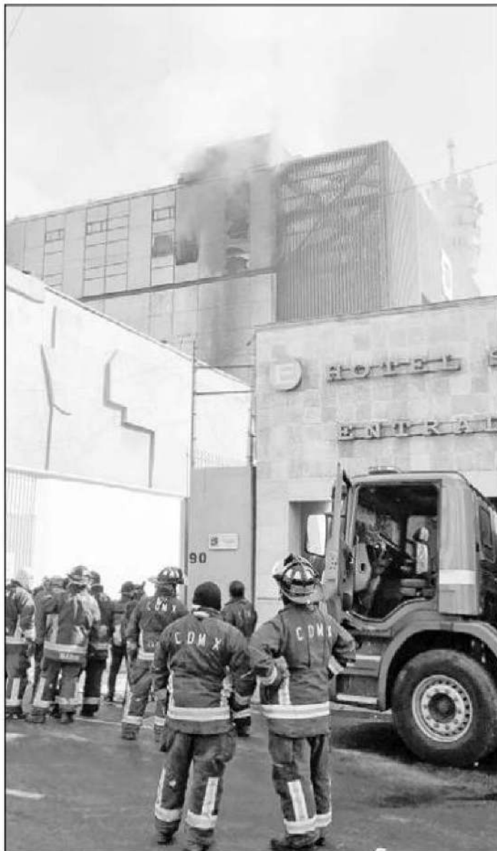
▲ Sobre la calle Ernesto Pugibet se estableció un cerco y decenas de bomberos acudieron a sofocar la conflagración, mientras los equipos de emergencia y ambulancias del ERUM trasladaron a los heridos.