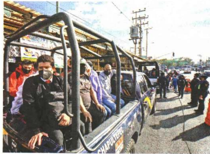
Usuarios del Metro tuvieron que ser transportados en camionetas de la Secretaría de Seguridad Ciudadana de la CDMX.

"Se tienen que esperar todos los peritajes, si es que es responsabilidad de un funcionario"