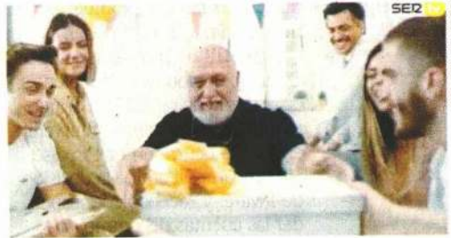
TOMADA DE VIDEO

Algunos países han lanzado campañas para invitar a los jóvenes a quedarse en casa y no llevar el virus a sus familias.