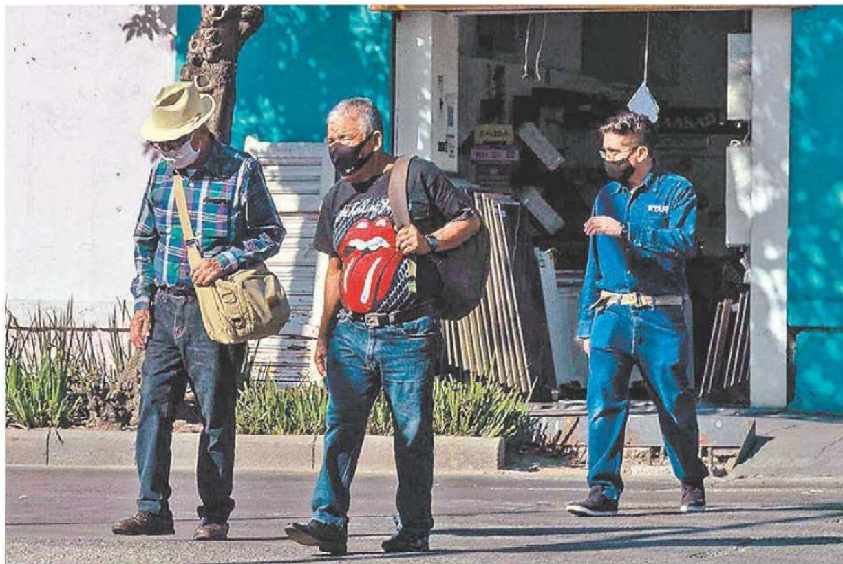
La capital permanecerá en semáforo rojo por el incremento de infecciones. OCTAVIO HOYOS