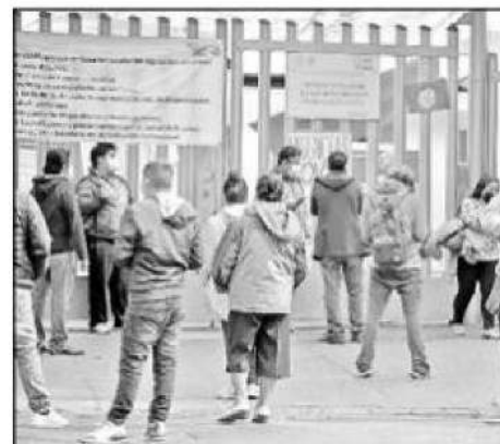
▲ Familiares esperan información de sus pacientes en el Hospital General Xoco.

Fuentes: Bloomberg y Secretaría de Salud/México Han sido vacunadas alrededor de 160 millones de personas en el mundo. La lista muestra el Top 20, con cifras a este fin de semana, pero cambian cada minuto.