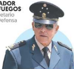
SALVADOR CIENFUEGOS Exsecretario de la Defensa

"Se pone en juego la credibilidad de una institución (DEA) y se tiene que aclarar"