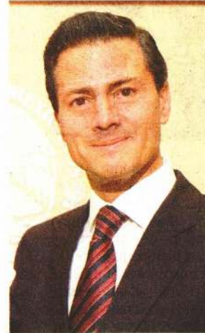
El presidente Enrique Peña Nieto, 2012-2018, aprobó la Ley General de Protección de Datos Personales.

Gracias a leyes y modificaciones en materia de transparencia, la ciudadanía cuenta con las herramientas para saber lo qué hace o no hace un presidente; aquí los casos: