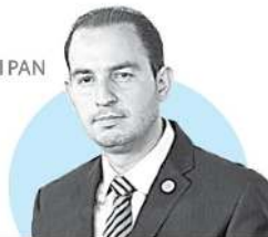
MARKO CORTÉS Presidente nacional del PAN

"El general Salvador Cienfuegos es un mexicano ejemplar y comprometido"