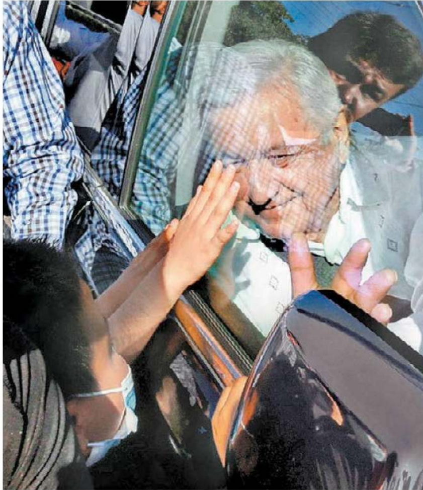
El Presidente en su gira por Guerrero. JAVIER RÍOS