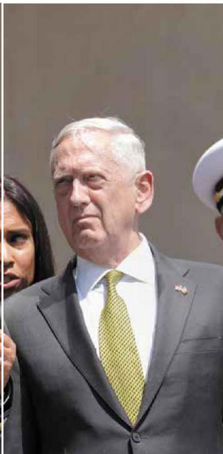
acusado de ligas con el narco.