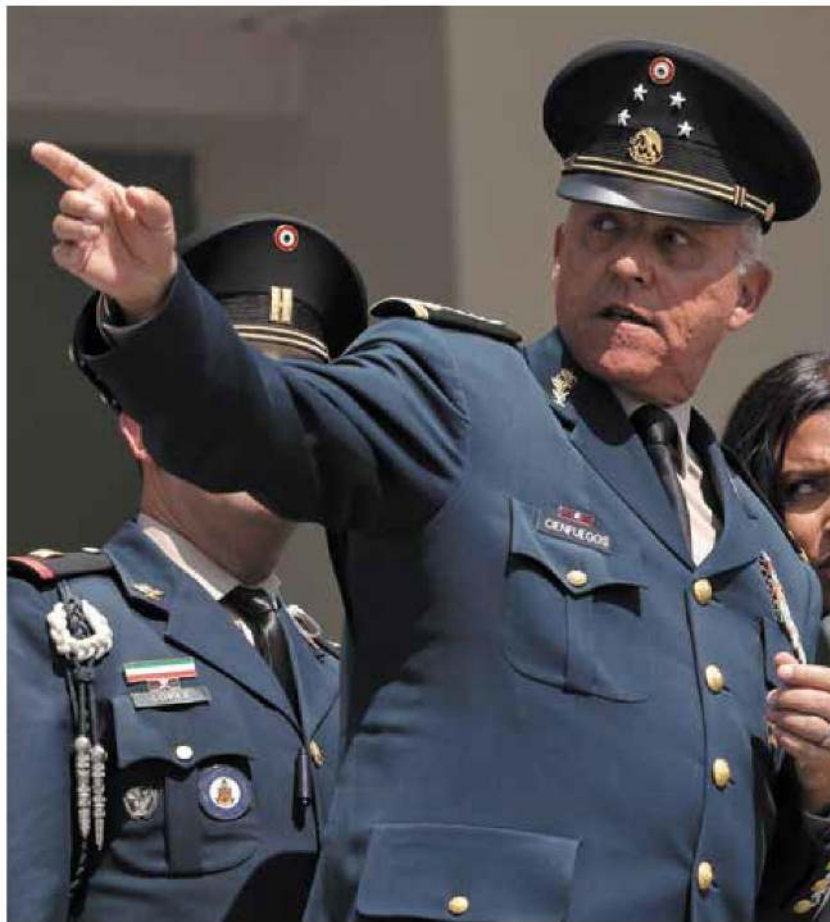
LIBRE. Salvador Cienfuegos, titular de la Sedena en el sexenio de Enrique Peña, fue