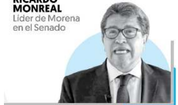
RICARDO MONREAL Líder de Morena en el Senado

"La justicia mexicana debe sentirse indignada por procesos arbitrarios"