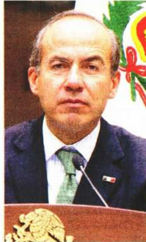
El presidente Felipe Calderón, 2006-2012; en su gestión se dio la protección de datos personales en posesión de entidades.