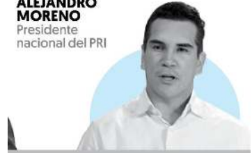
ALEJANDRO MORENO Presidente nacional del PRI

"La justicia mexicana debe sentirse indignada por procesos arbitrarios"