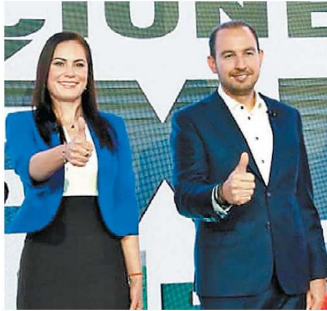
La alianza presentó sus propuestas legislativas. ESPECIAL