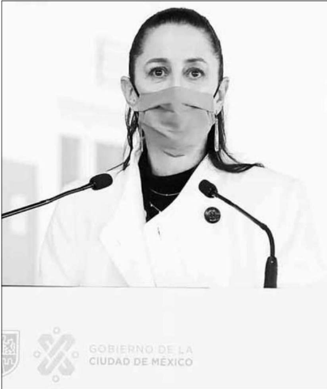
► Claudia Sheinbaum señaló que las pesquisas por el fraude de casi mil millones de pesos desde altas esferas de la gestión anterior forman parte de la cero tolerancia a la corrupción de su gobierno.