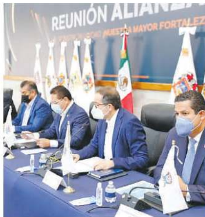
Gobernadores defienden los sistemas estatales de salud

LA ALIANZA Federalista defiende que sean los sistemas estatales de vacunación los que apliquen las dosis; consideran que las Brigadas Correcaminos son innecesarias