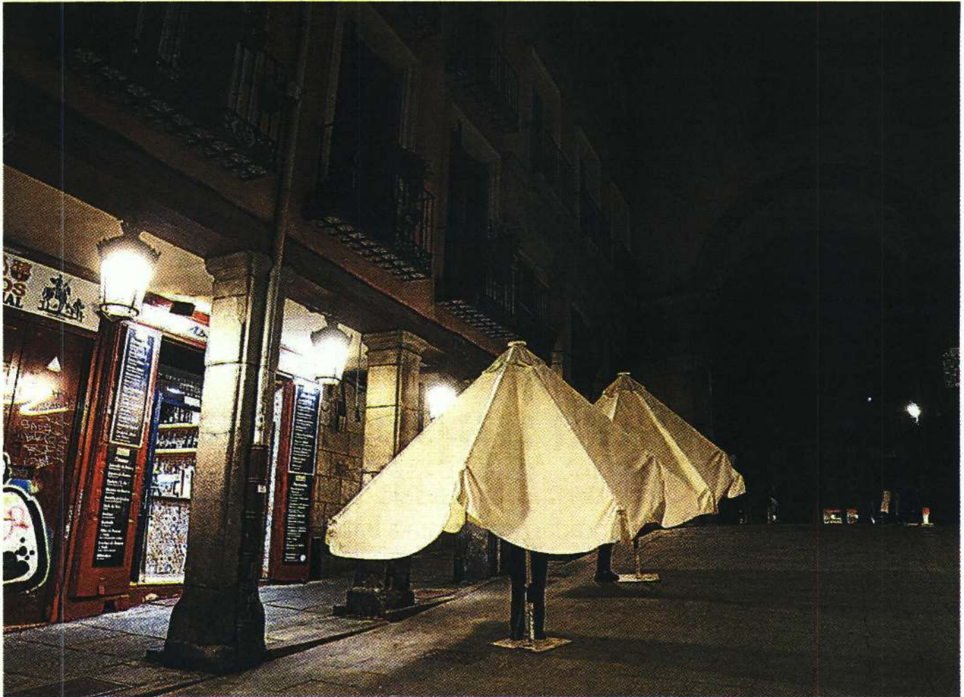
Un bar del centro de Madrid recoge su terraza a causa de las nuevas restricciones horarias en la capital. ALBERTO DILOLLI