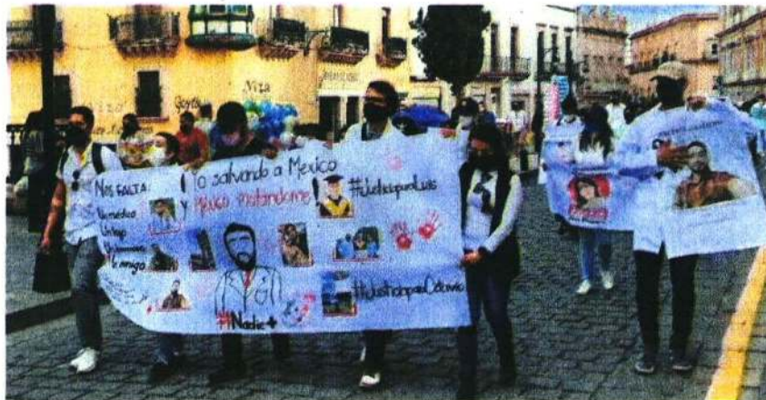
Jóvenes estudiantes se manifestaron tras los asesinatos de dos paramédicos que habían trasladado a un paciente a Zacatecas.