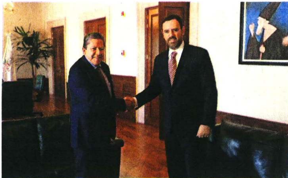
El 2021 fue un año electoral y el estado cambió de un gobierno priista a uno morenista liderado por David Monreal Ávila.