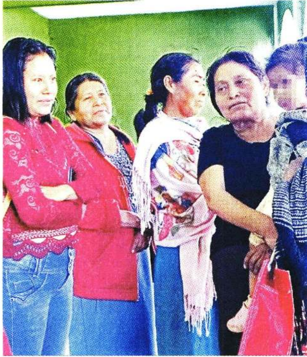
■ Un grupo de mujeres de Copanatoyac se inconformó porque los hombres les impidieron votar en una elección de comisario.