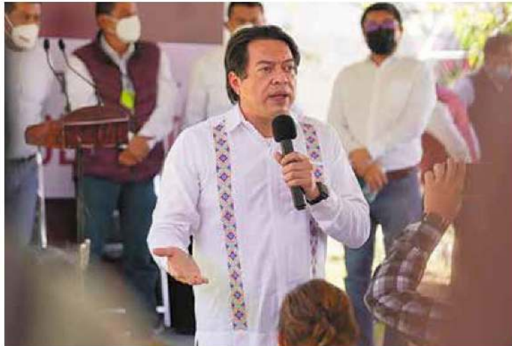
EXIGENCIA. Mario Delgado, líder nacional de Morena, ayer.