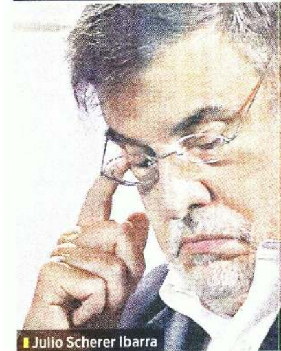
■ Julio Scherer Ibarra