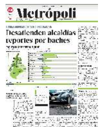
Gráfico: Rodolfo Gómez