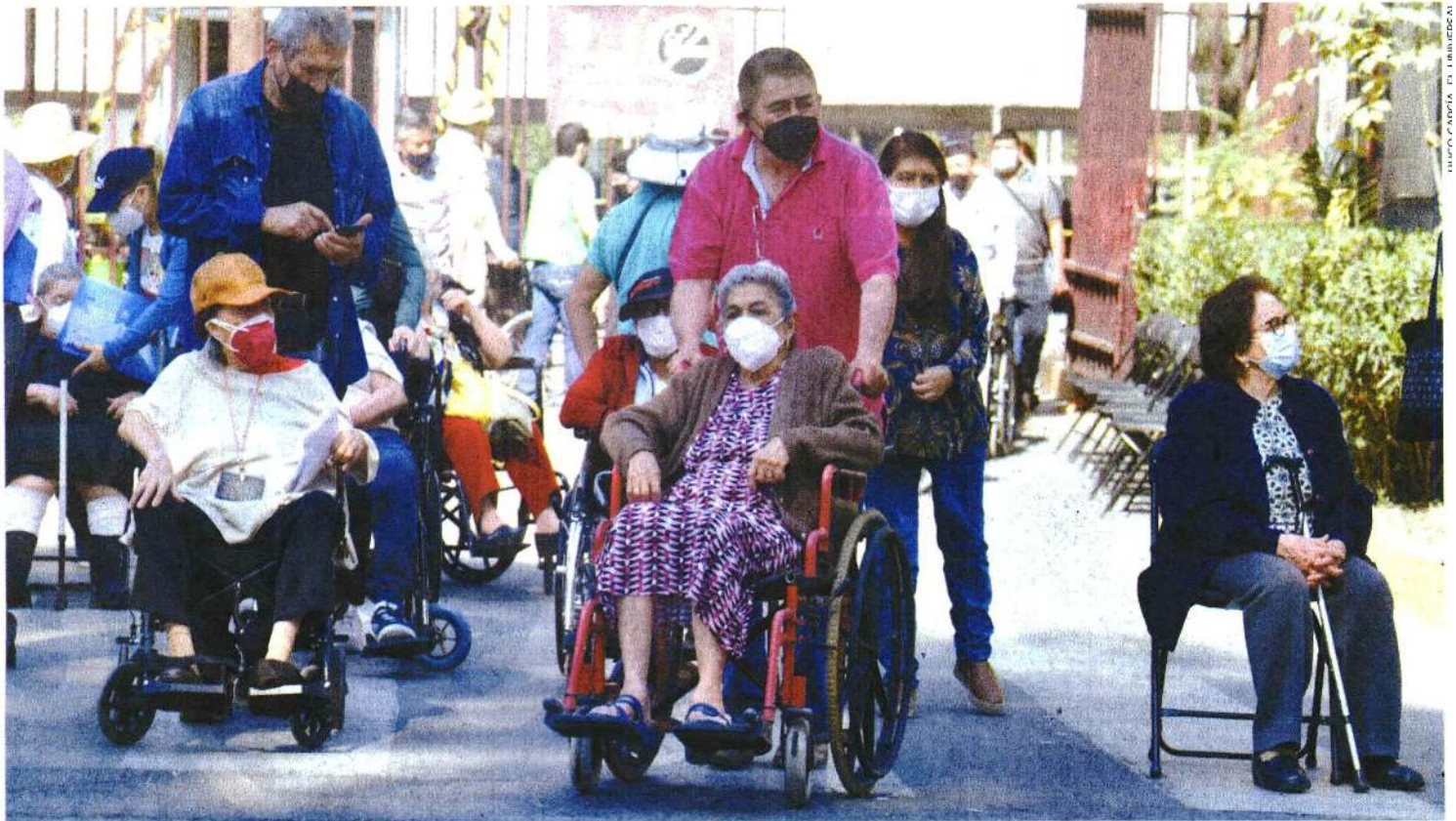
Ante el temor por la cuarta ola de Covid-19, miles de adultos mayores acudieron a aplicarse la dosis de refuerzo en el Centro Cultural Jaime Torres Bodet del IPN.