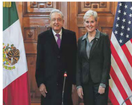
AMLO Y GRANHOLM. EU recibió una breve descripción de la reforma eléctrica.