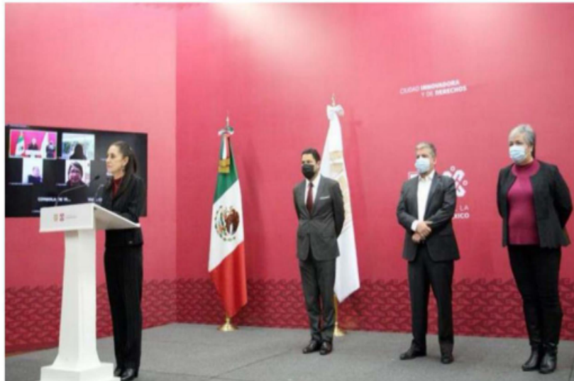
Claudia Sheinbaum, jefa de Gobierno capitalino, con los integrantes de su gabinete.

“Esta beca Bienestar para Niños y Niñas garantiza eso, garantiza el derecho a la educación y el reconocimiento a nuestros niños y niñas de la Ciudad de México, los que van a escuela pública; es la garantía de que siempre haya un recurso de los recursos públicos del pre-