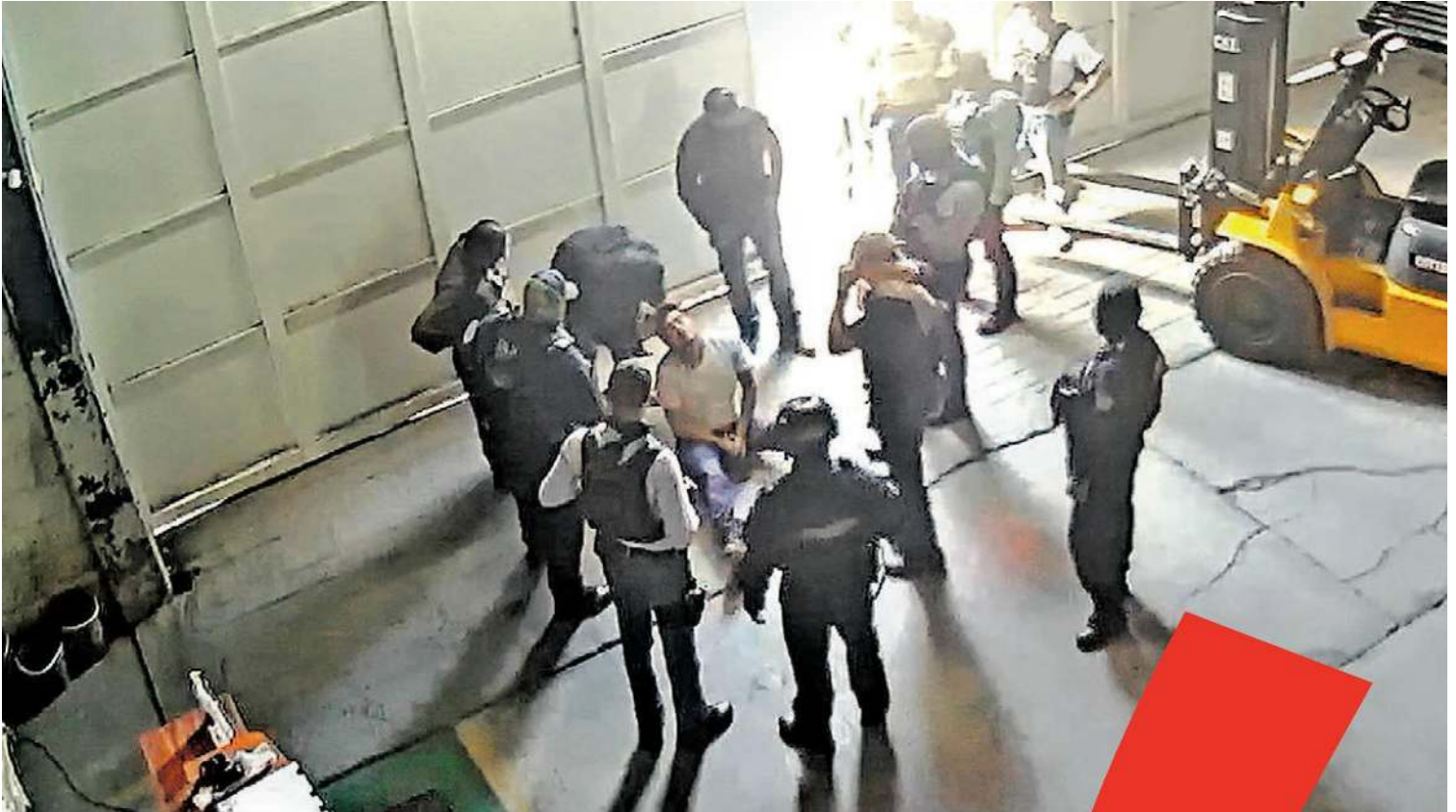
Policías de Veracruz golpean a un trabajador en una bodega para obtener información