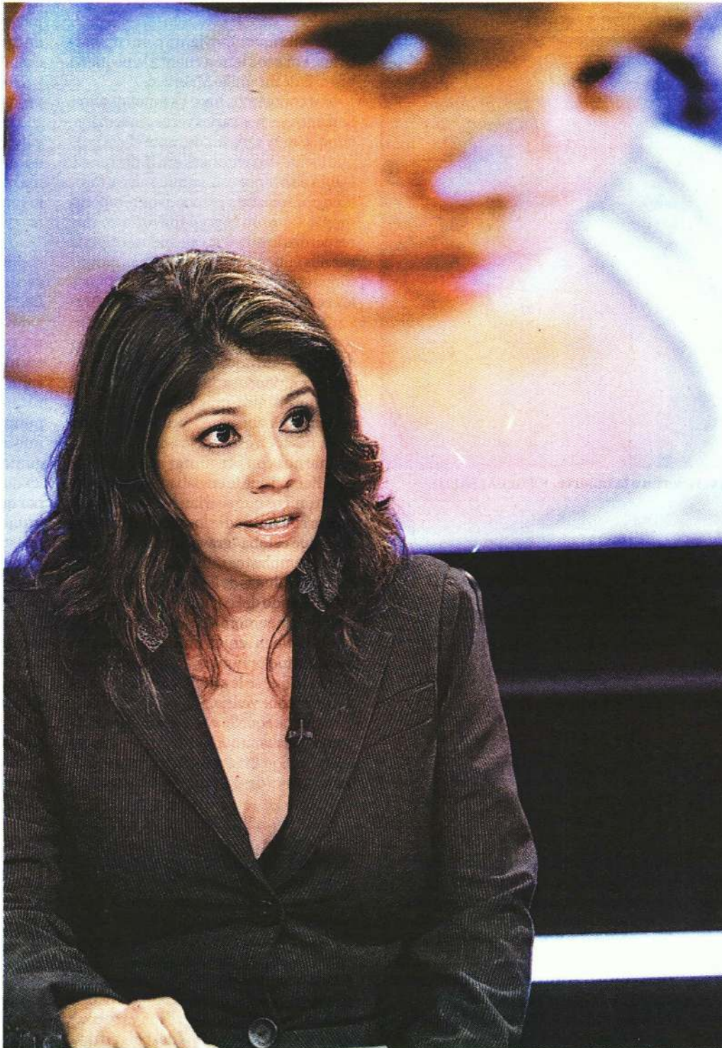
La fundadora de Ana Karen Vive en entrevista con MILENIO Televisión.