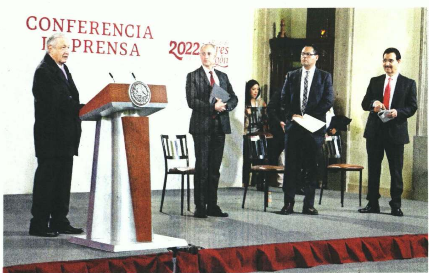
En Palacio Nacional, durante la conferencia matutina de ayer, concluyó la presentación de propuestas por parte de los aspirantes para encabezar el Sindicato de Trabajadores Petroleros de la República Mexicana (STPRM).