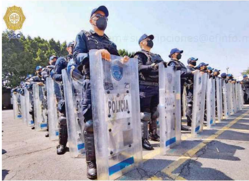
Conminan al presidente de México a fortalecer las policías civiles en defensa de los ciudadanos