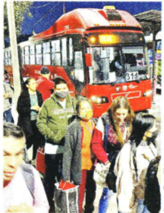
El servicio emergente siguió operando en el tramo restante de la Línea Dorada.