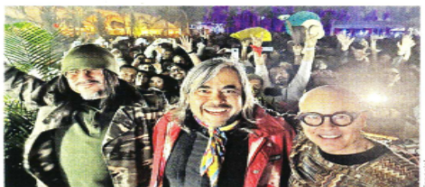
El concierto se realizó el fin de semana, en un espacio que ya lo nombran como el 'Tulum de la CDMX'.

Las agentes ahora son investigadas por la presunta coacción y abuso de autoridad, además de que la Comisión de Honor y Justicia del Municipio también inició un expediente.