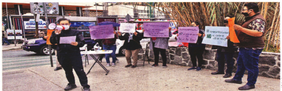
ALZAN LA VOZ. Vecinos de las colonias Granada y Ampliación Granada exigen opinar sobre las modificaciones al Plan Parcial.