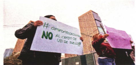
Colonos temen falta de servicios, como agua potable, entre otras afectaciones con los cambios de uso de suelo aprobados.

Asimismo, criticó que, pese a que fueron destinados recursos de Presupuesto Participativo a la creación de un Plan Parcial que permita regular el entorno urbano de las colonias, autoridades no