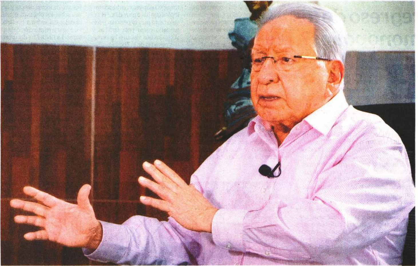
Aquiles Córdova Morán, líder del Movimiento Antorchista Nacional.