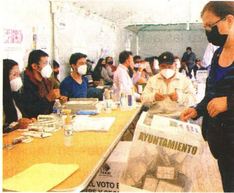
En la jornada electoral 2021 se debe contar con avisos de privacidad y cuidado en el manejo de datos de 92 millones de electores, dice Inai.

rigentes estatales de los partidos nacionales en Guanajuato y del organismo político estatal. ●