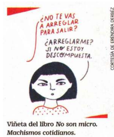
Viñeta del libro No son micro. Machismos cotidianos.