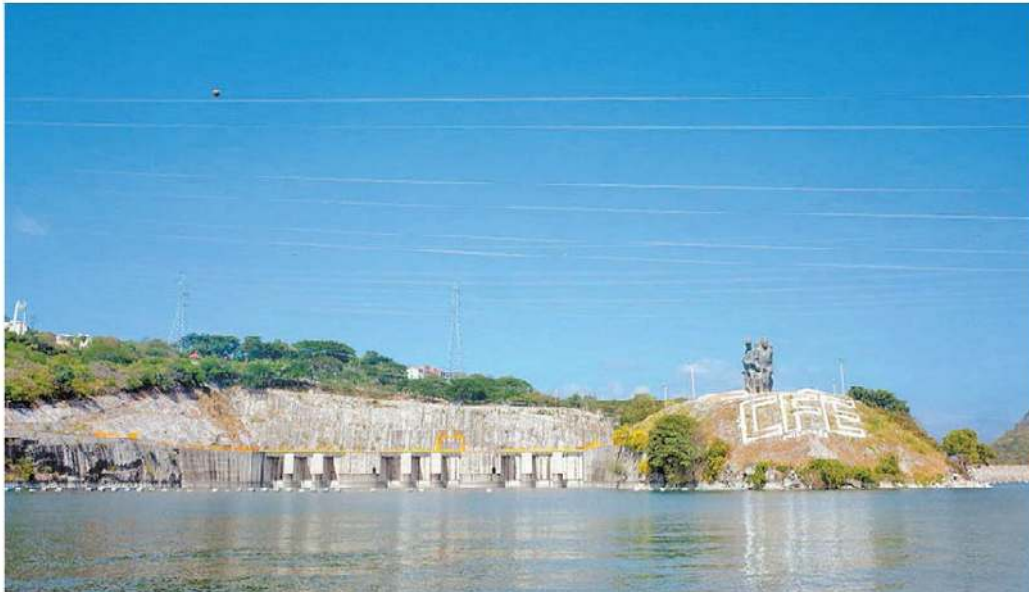
La medida pone en primer lugar las plantas hidroeléctricas de la comisión.