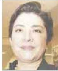
Por Guillermina Gómora Ordóñez