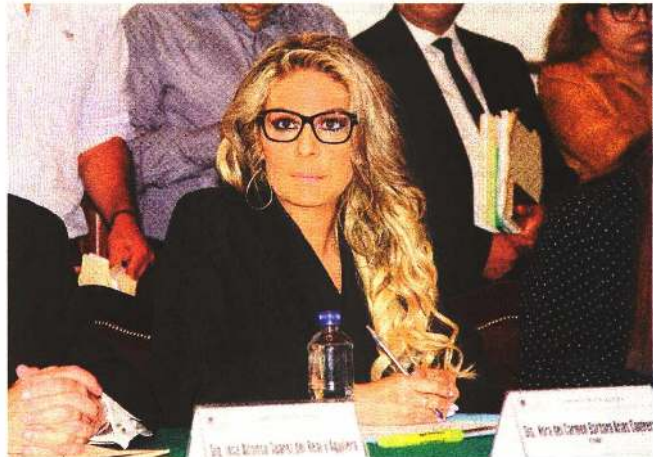
Noria Arias Contreras, líder del PRD, adelantó que el acuerdo para candidatos comunes quedará listo antes del 4 de marzo.