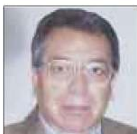
Por Roberto Vizcaino