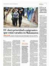
El día pasado a migrantes que están varados en Matamoros

Las autoridades estadounidenses recalcaron que están trabajando de manera muy estrecha con el gobierno de México y con organizaciones internacionales y humanitarias en la frontera sur. ■■■