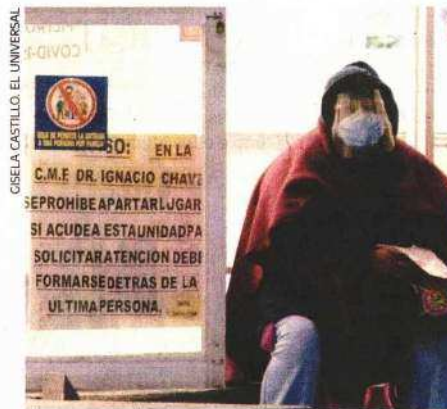
Para sobrellevar la espera y el frío, algunas personas llevan consigo sillas, bancos y cobijas.