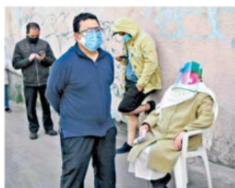
SABIOS. Previniendo que se tardaría horas en obtener la vacuna, muchos acudieron con sillas y bancos para poder descansar mientras avanzaba la fila.