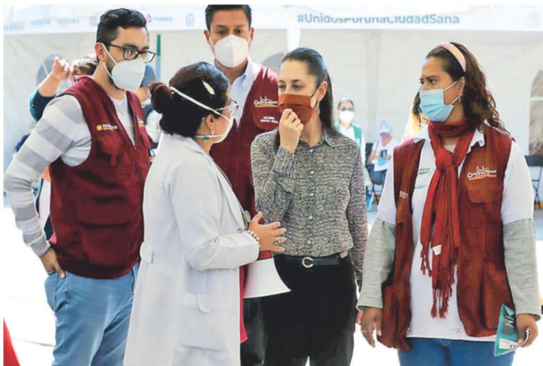
En caso de no aplicar las 35 mil dosis diarias, estas serán resguardadas en refrigeración, informó la mandataria capitalina. Especial

Agregó que en caso de que no se apliquen las 500 dosis diarias en estos lugares serán resguardadas en frío en las distintas jurisdicciones de Salud