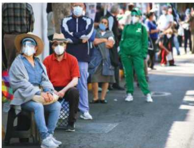
LOS PRIMEROS convocados ayer en San Jerónimo, alcaldía Magdalena Contreras, esperan su turno sentados en bancos o en la banqueta con la esperanza de recibir el biológico contra el Covid.

"QUÉ BUENO QUE LLEGÓ, PORQUE YA HAY MUCHOS DIFUNTOS"