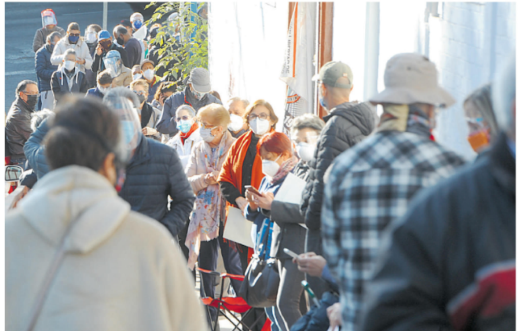
Hijos y nietos trasnocharon y madrugaron para lograr que sus familiares obtuvieran la primera dosis

El Subsecretario de Prevención y Promoción de la Salud, Hugo López-Gatell, afirmó que fue poco fina la aplicación. “No fue con la celeridad ni con la fineza la