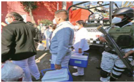
El traslado de las vacunas se hizo bajo resguardo de la Guardia Nacional y policías de la Secretaría de Seguridad Ciudadana.

rían de llamar, pero te reparten un papel de Morena y la gente se está muriendo, casi tres horas y no pasamos, somos los segundos 20, pero aquí seguimos afuera", dijo Samuel Gómez, de 88 años, quien fue llevado por un chofer.