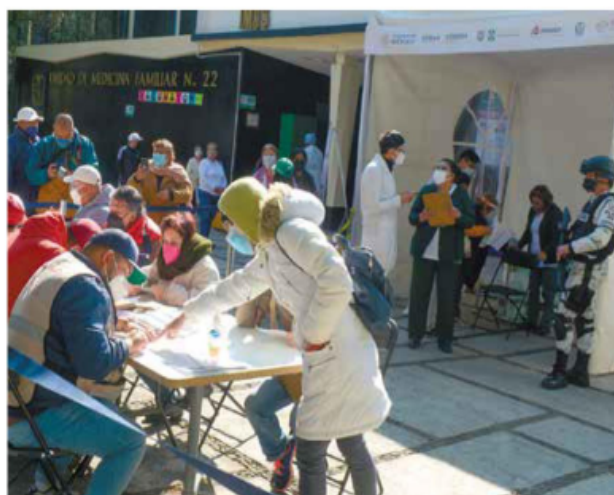
INICIO. La campaña de inmunización en adultos mayores, ayer, en Edomex, Quinta-