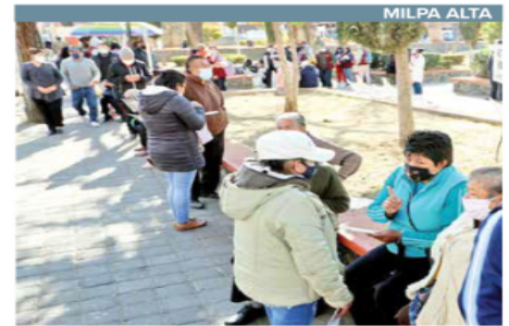
Desde la madrugada comenzaron a formarse filas para ingresar al Centro de Salud T-II Dr. Luis Alberto Erosa León, en Milpa Alta.