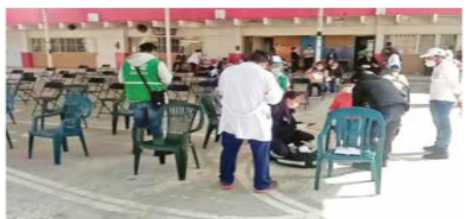
El incidente se presentó en la escuela Cuauhtémoc, ubicada en Alcanfores y San Bernabé, en la alcaldía La Magdalena Contreras.

mujer, quien presentó elevación de la glucosa, por lo que se determinó trasladarla al hospital Enrique Cabrera.