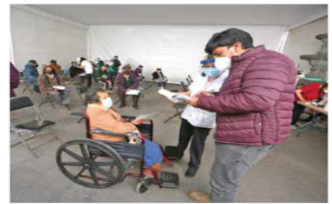
La jefa de Gobierno instruyó a personal del gobierno para que ayude a los servidores de la nación y agilicen los registros.

Tiene la esperanza de que la vacuna ayude a su pueblo a recuperarse económicamente. Ella y su esposo se dedicaron a producir y vender moho desde 1963, pero afirma que la pandemia afectó al suyo y muchos otros negocios.