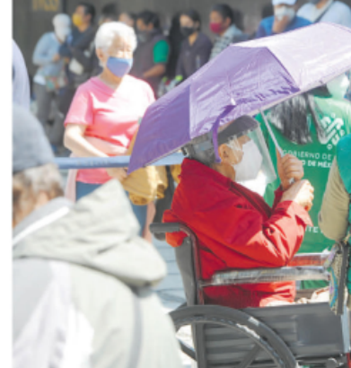
Pocos adultos mayores previnieron su espera con sombrillas y bancos