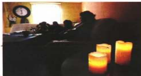
La falta de energía eléctrica que se registró ayer comenzó cerca de las 7 de la mañana y en algunas zonas se extendió hasta las 23:00 horas.