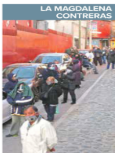
Desde las 5:00 horas ya había unas 70 personas formadas.

"Llegue a las 5 de la mañana. Es algo que estaba buscando hace un buen rato, creo que es la salida que estábamos buscando todos, desde los jóvenes hasta los adultos",