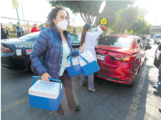
En algunos puntos de aplicación, las vacunas tardaron en llegar hasta dos horas y media