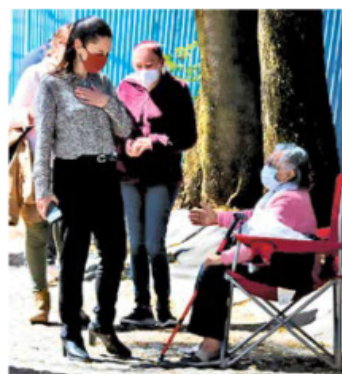
INSPECCIÓN. La jefa de Gobierno supervisó la vacunación en Cuajimalpa.