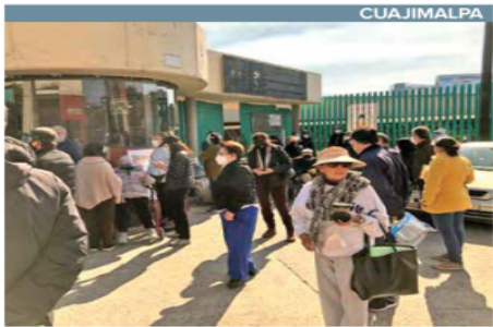
Al IEMS Josefita Ortiz de Domínguez, en la colonia El Molinito, en Cuajimalpa, llegaron personas de estratos sociales muy distintos.

Aprueban firmas amigables con el ambiente. Veinte empresas ya obtuvieron su registro para producir bolsas compostables, bolsas reutilizables y otros productos plásticos compostables, anunció ayer la Secretaría del Medio Ambiente (Sedema). Hasta ahora la autoridad ha recibido 47 solicitudes de interesados en comercializar y distribuir dichos productos.