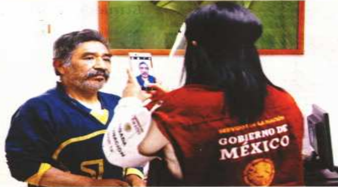
En módulos de la CDMX los servidores de la nación tomaron fotos a las personas vacunadas.

Con la participación de los servidores de la nación, el gobierno federal informó que, hasta las 16:00 horas de ayer, habían sido vacunados 23 mil 369 adultos mayores contra Covid en 320 municipios de 30 estados. Tamaulipas inicia hoy y Nuevo León pospuso el arranque por el mal clima. Por la noche, el gobierno de la Ciudad de México detalló que ayer se aplicaron 30 mil 265 dosis en la capital del país.