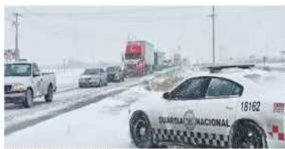
'CONGELADOS'. Operativos de GN en Chihuahua ante las condiciones climáticas.

El servicio se restableció solo para una parte de los usuarios