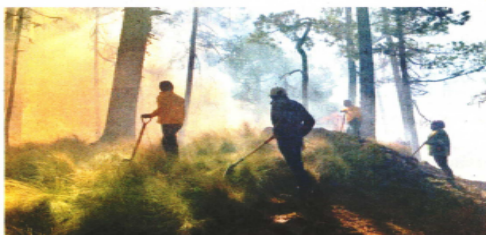
Trabajadores de la Conanp, Protección Civil y Medio Ambiente fueron los encargados de controlar el fuego.

Estado de México (SSEM), indicaron autoridades locales.