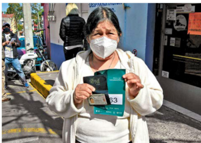
LOS PRIMEROS. Ayer, adultos mayores de tres alcaldías acudieron a formarse bajo el sol; los más afortunados contaron con familiares que se formaron por ellos.

En un recorrido realizado por 24 HORAS en la primaria Héroes de Padierna, alcaldía Magdalena Contreras, se observó que las largas filas de gente rodeaban la manzana