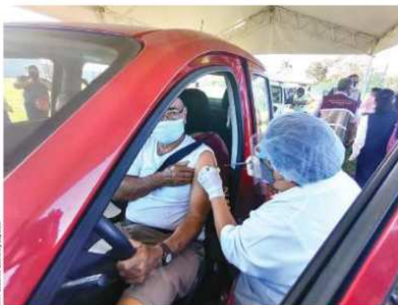
EN CUNDUACÁN, Tabasco, como en el estadio de los Yankees, la inmunización ayer se hizo sin que los adultos mayores bajaran de los vehículos (foto), es un programa piloto, afirma el gobernador Adán Augusto López.

HASTA OCHO HORAS EN FILA, PERO AL FINAL CELEBRAN PROTECCIÓN