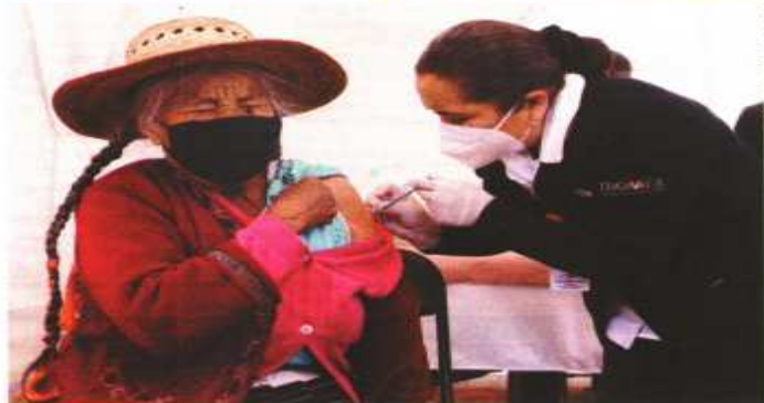
En el Estado de México se aplicaron las dosis en comunidades indígenas alejadas.

ALERTA MUNDIAL COVID-19 EN MÉXICO 1,995,892 CASOS CONFIRMADOS 174,657 MUERTOS