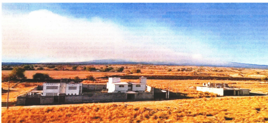
El humo provocado por el incendio en la zona del Nevado de Toluca se pudo percibir en las zonas cercanas, donde vecinos se mostraron preocupados por el posible daño ecológico del siniestro.

También se recibió el apoyo de la Policía de Alta Montaña de la Secretaría de Seguridad del