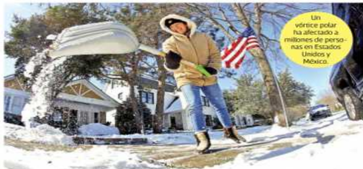
Un vórtice polar ha afectado a millones de personas en Estados Unidos y México.

El frío extremo que azota a Estados Unidos ha provocado un aumento de 20% en la demanda de energía en ese país, lo que conlleva el incremento de la necesidad de gas natural y aumento en sus precios, situación que afecta a México, ya que cerca de 60% de la