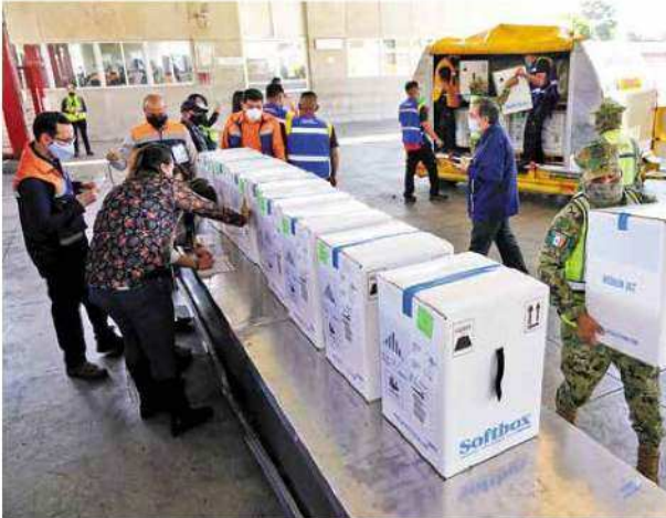
DÍADOS. Ayer continuó la jornada de vacunación para adultos mayores en el país.