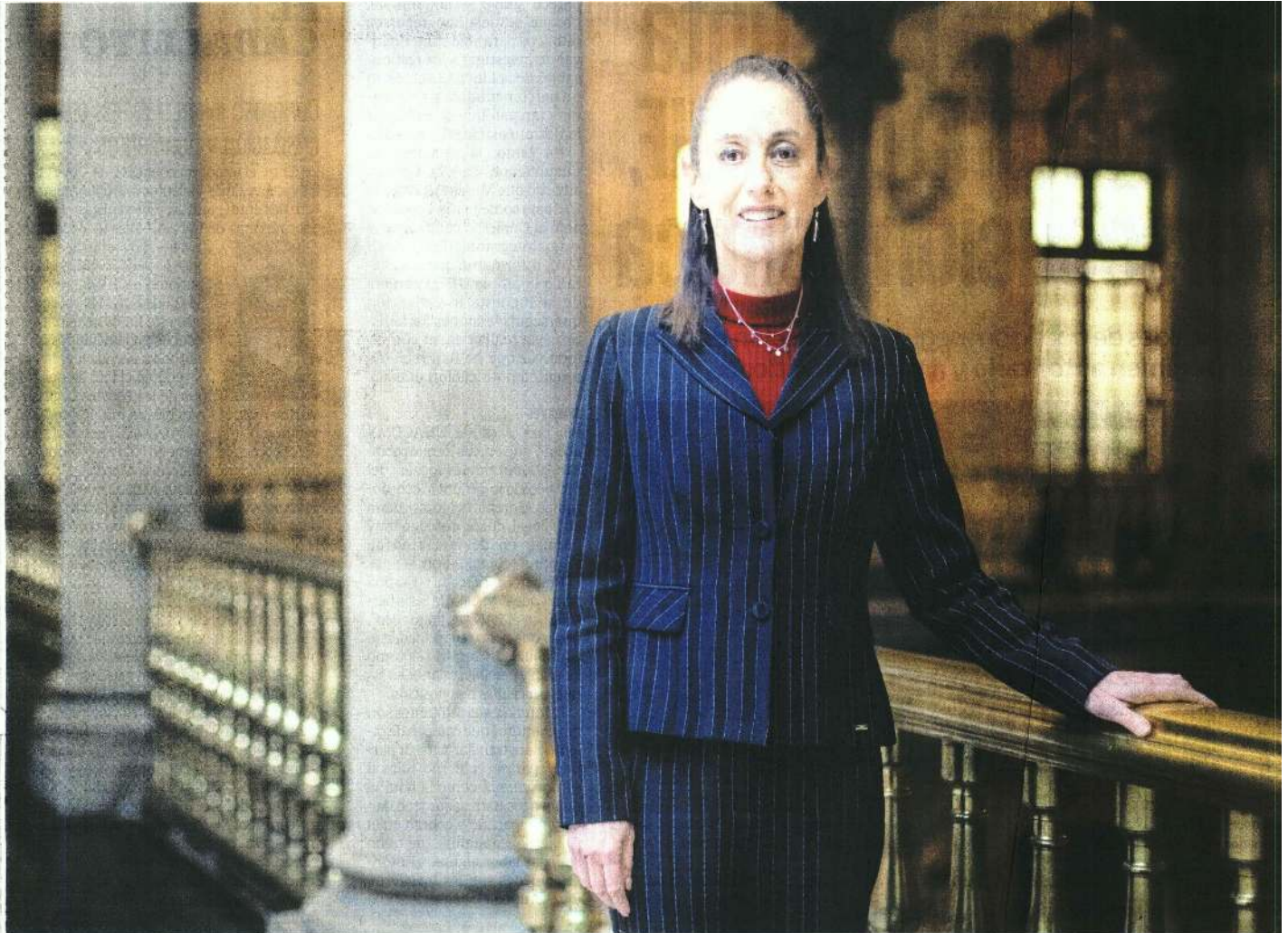
Claudia Sheinbaum Pardo es la primera jefa de Gobierno electa en la capital del país (2018-2024). Define su administración como de innovación y derechos.