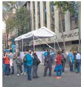
EXPECTATIVA. Trabajadores permanecieron atentos al proceso.