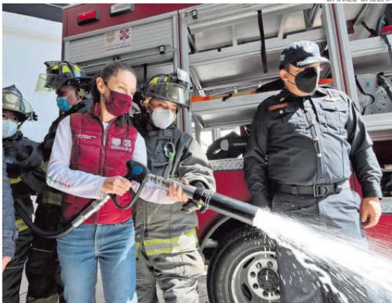
La nueva estación tiene capacidad para 100 bomberos