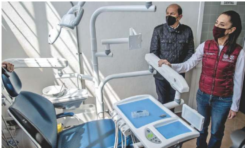
Claudia Sheinbaum , jefa de Gobierno de la CDMX, recorrió las instalaciones del nuevo albergue y llamó a los ciudadanos a ser solidarios.