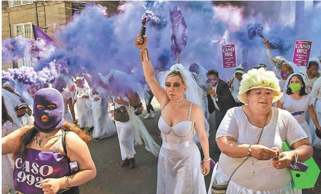
Manifestación contra la violencia vicaria en noviembre pasado.