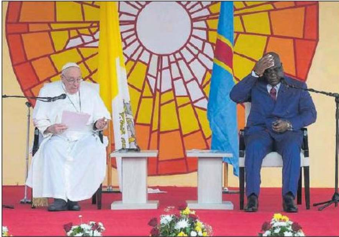
El Pontífice y el presidente de la República Democrática del Congo, Félix Tshisekedi, ayer.