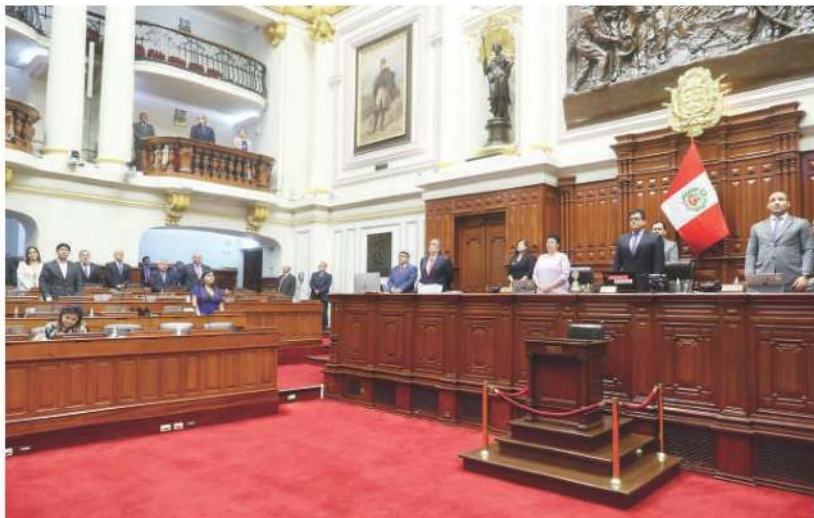
Boluarte y el partido fujimorista de derecha Fuerza Popular defienden el adelanto de elecciones para apaciguar las protestas.