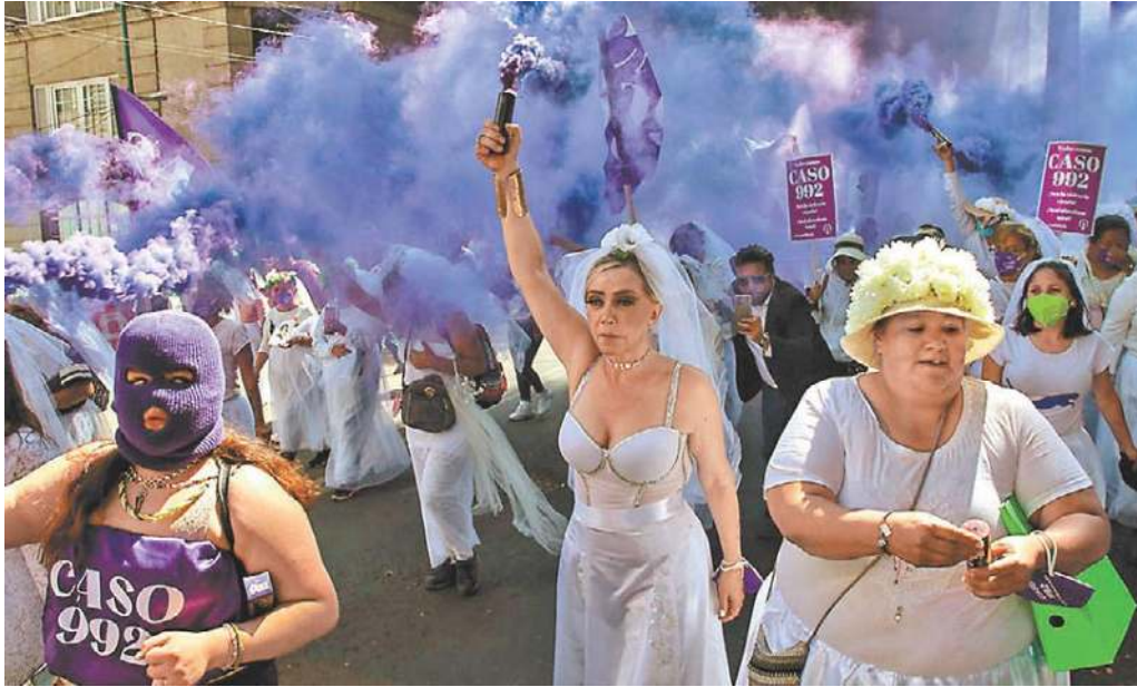
Manifestación contra la violencia vicaria en noviembre pasado.