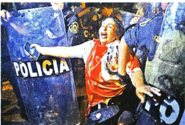
Agentes agarraron a una mujer durante una manifestación nocturna en Lima. Se reportaron algunos arrestos.