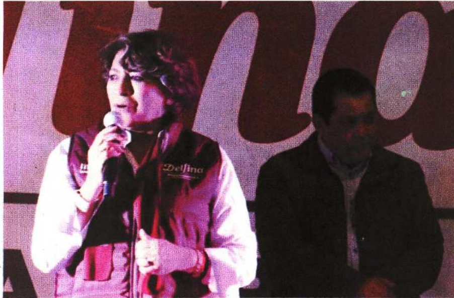
Delfina Gómez, precandidata de Morena, dijo que los jóvenes anhelan un verdadero cambio