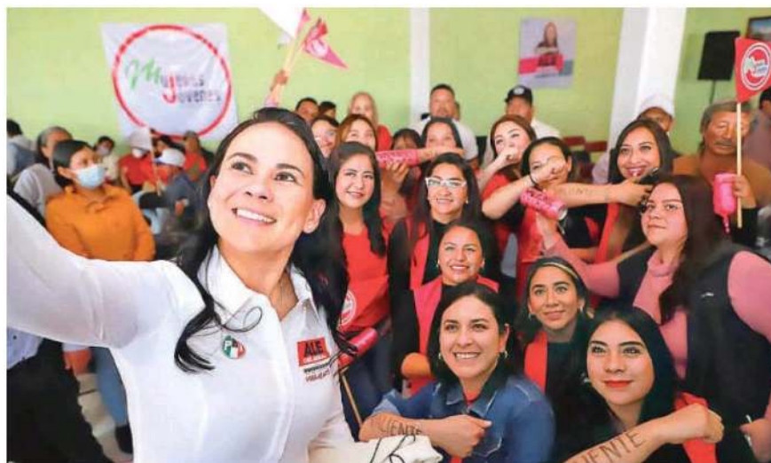
Precandidata del PRI al gobierno del Estado de México, Alejandra del Moral Vela con militantes de su partido en el municipio de Isidro Fabela

"Este es el tipo de cambio que estamos proponiendo, dejar el odio atrás y la división, para trabajar en equipo y armonía por el bien de todas y de los que vivimos en el Estado de México", enfatizó la precandidata del Partido Revolucionario Institucional (PRI) a la militancia tricolor.