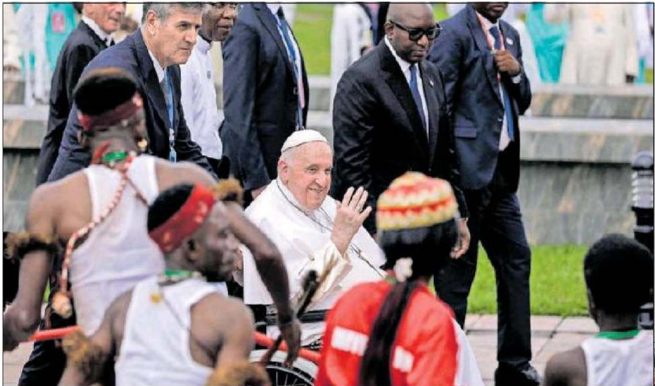
El Papa saludaba ayer en el aeropuerto de Kinsasa.