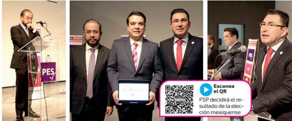
Los líderes partidistas manifestaron que su fuerza política suma cerca de 500 mil votos