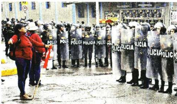
La Policía reforzó la seguridad del aeropuerto internacional de Lima ante el intento de manifestantes de acercarse.

Las operaciones del aeropuerto capitalino no se vieron afectadas, según reportes.