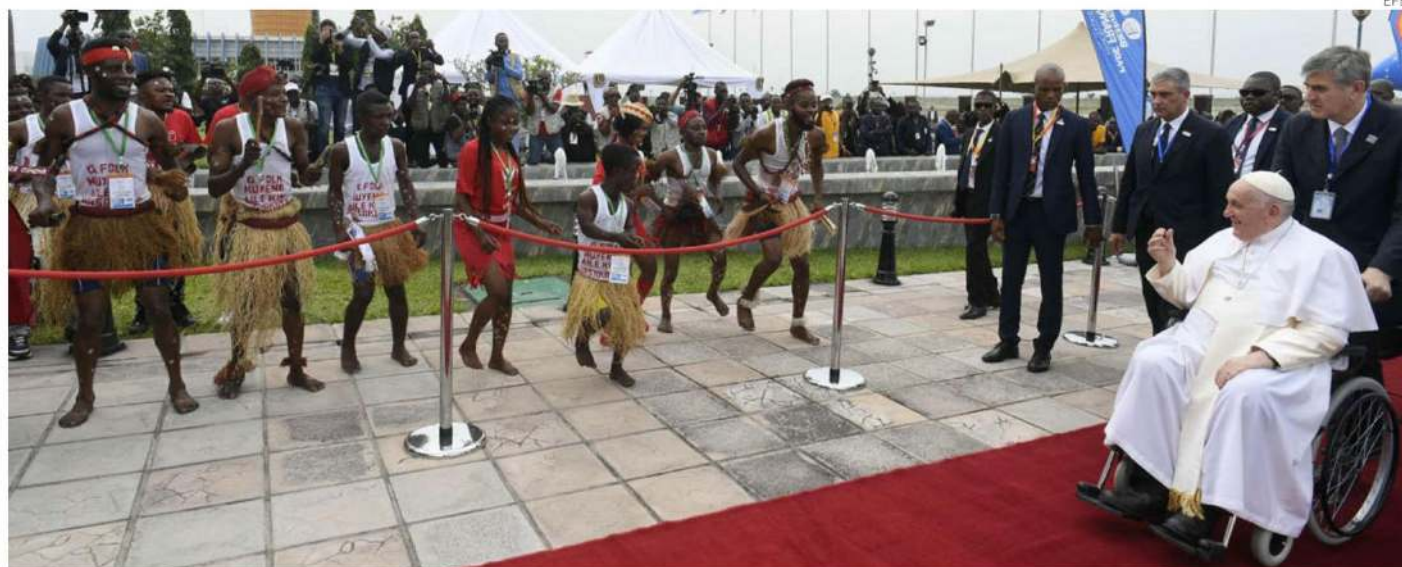
Jóvenes reciben con cánticos y danzas a un sonriente Francisco a su llegada al aeropuerto de Kinshasa, capital de la República Democrática del Congo.