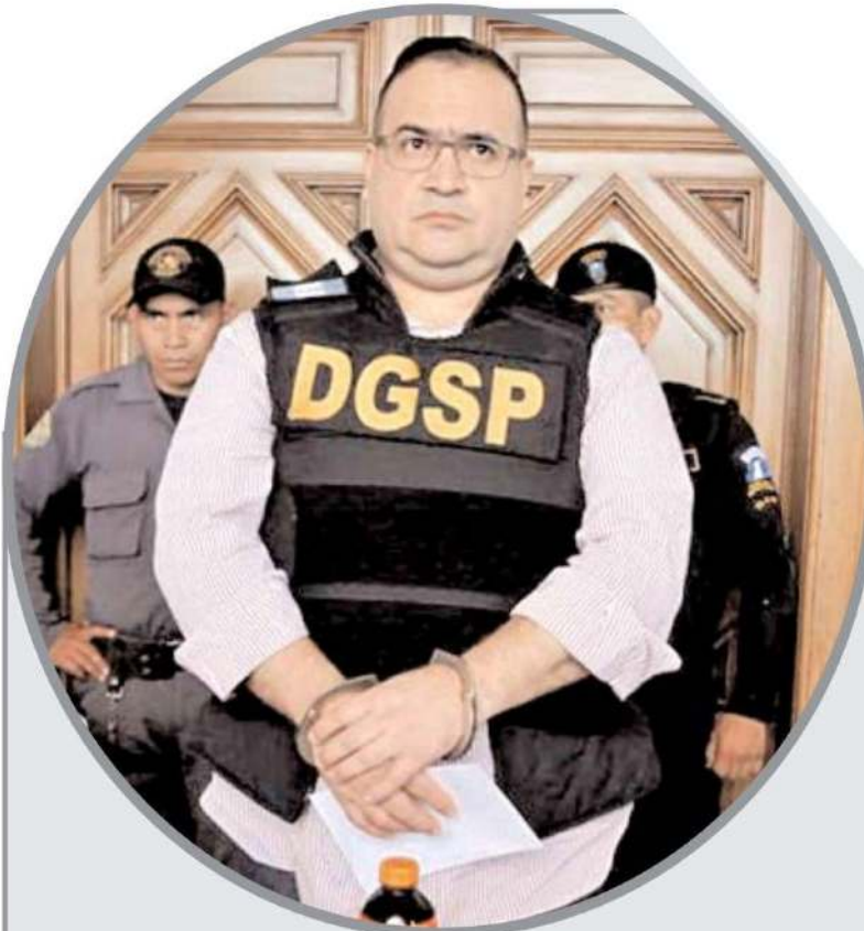
Javier Duarte de Ochoa