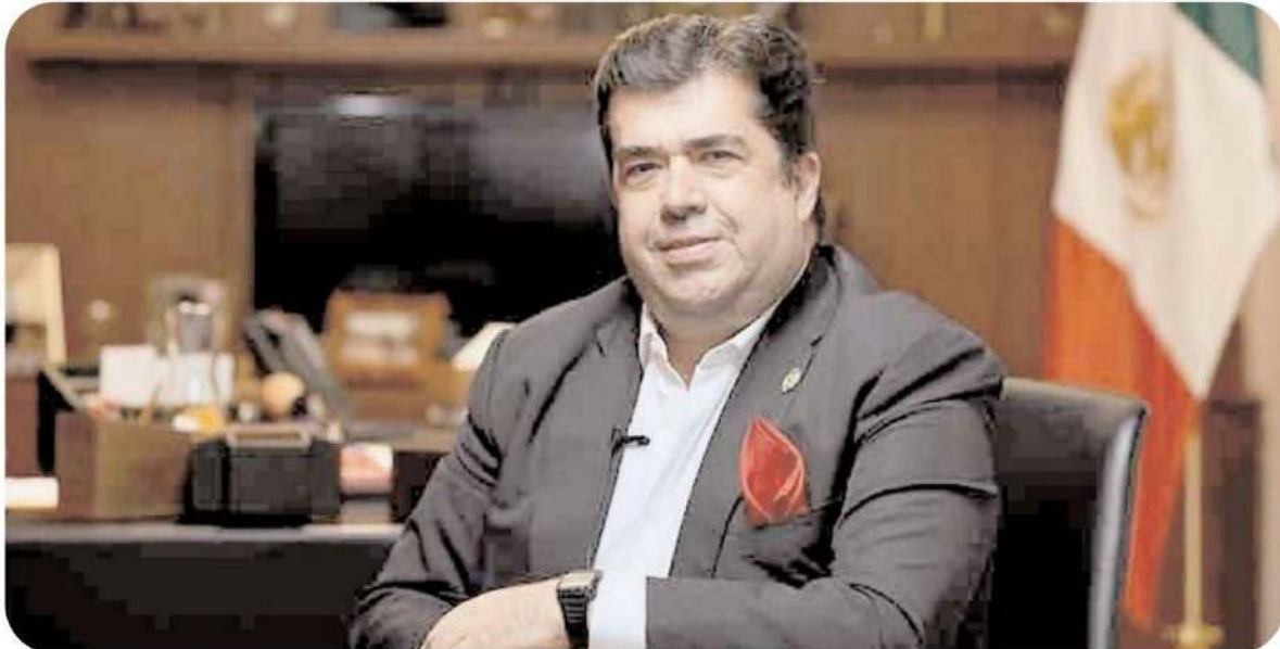
Pedro Miguel Haces Barba, exdirigente del PRI