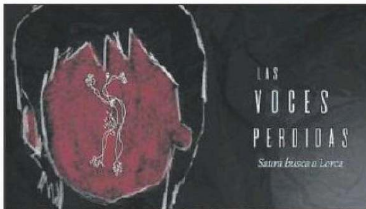
Dibujo de Carlos Saura para el dossier de la serie Las voces perdidas .

Los guiones ya están escritos y tienen a una mujer como protagonista