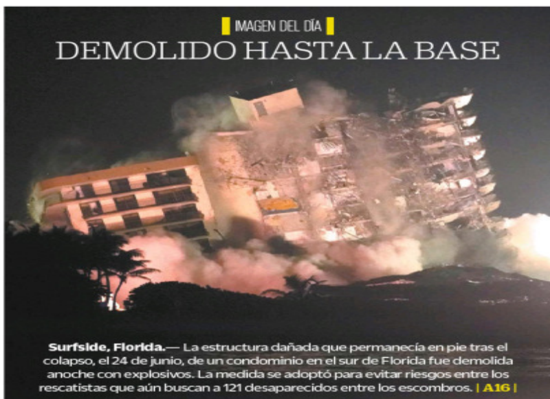
IMAGEN DEL DÍA DEMOLIDO HASTA LA BASE

Surfside, Florida.— La estructura dañada que permanecía en pie tras el colapso, el 24 de junio, de un condominio en el sur de Florida fue demolida anoche con explosivos. La medida se adoptó para evitar riesgos entre los rescatistas que aún buscan a 121 desaparecidos entre los escombros. | A16 |