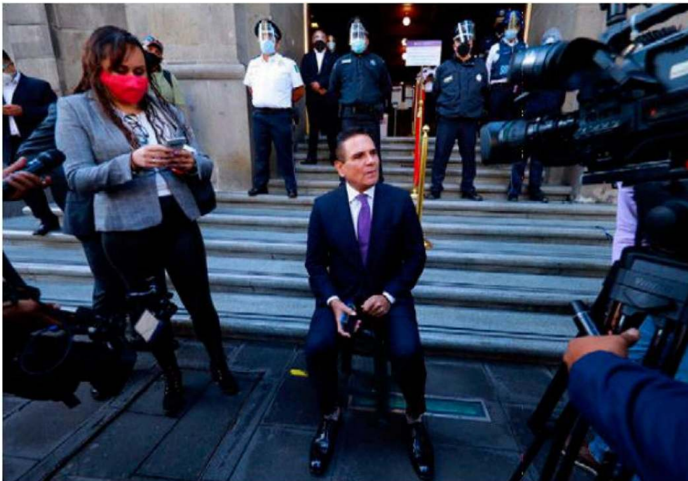
El gobernador Silvano Aureoles, en la entrada de la Suprema Corte de Justicia.