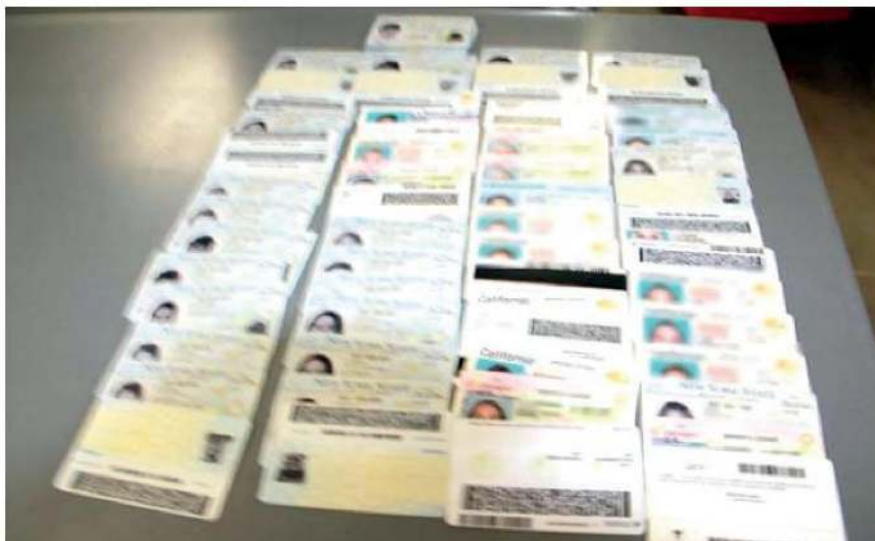
Buscan desalentar esta práctica ilícita