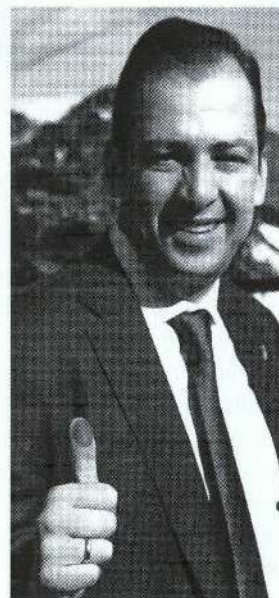
José Luis Vargas

Terminados los cómputos oficiales de los votos, concluye el papel del INE y de los treintaidós institutos electorales locales para dar paso y entrada a la escena de los tribunales electorales. Son treintaidós los de ámbito local, más las cinco salas regionales y la Sala Superior del TEPJF, ésta última presidida por el cuestionado magistrado José Luis Vargas, al que cinco de sus colegas señalan por violar las elementales