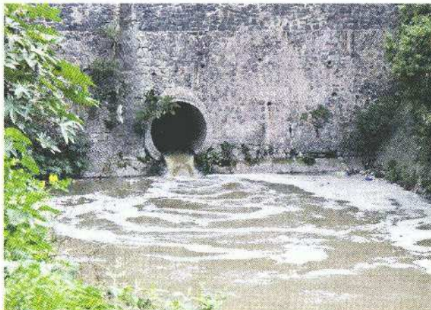
■ Hay un Vactor, un camión con bomba, para evitar que baje demasiada agua con mucha basura.