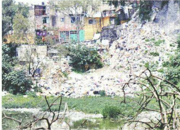
■ En 2019, el Gobierno gastó 150 millones de pesos para desazolver siete presas de Álvaro Obregón.