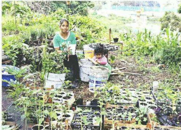
■ Vecinos señalan que casas colindantes al recinto avientan la basura y otra es arrastrada por la lluvia.