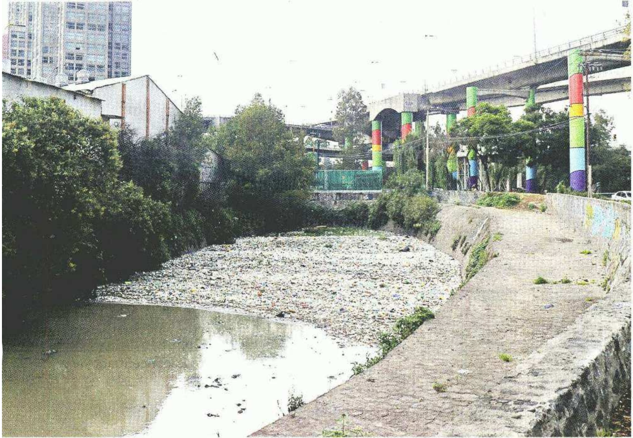
■ De 2000 a 2018 fueron extraídos 267 mil toneladas de azolve y basura de la presa ubicado en Río Becerra.