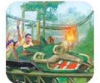
Vuelo de Quetzalcóatl