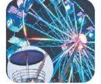
Rueda de los Barrios