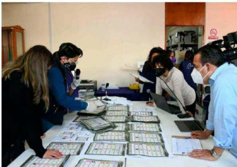
EL IECM debió realizar el conteo respecto de 37 casillas.