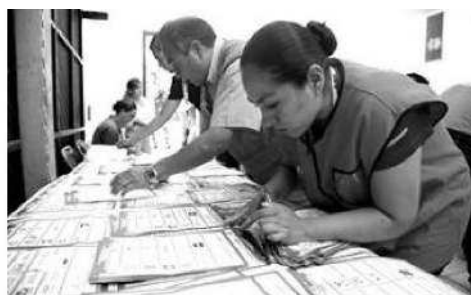
Fueron abiertos 22 paquetes

El apoyo al voto también ocurrió a lo largo del lunes, mientras se realizó el recuento de 99 mil 841 sufragios.