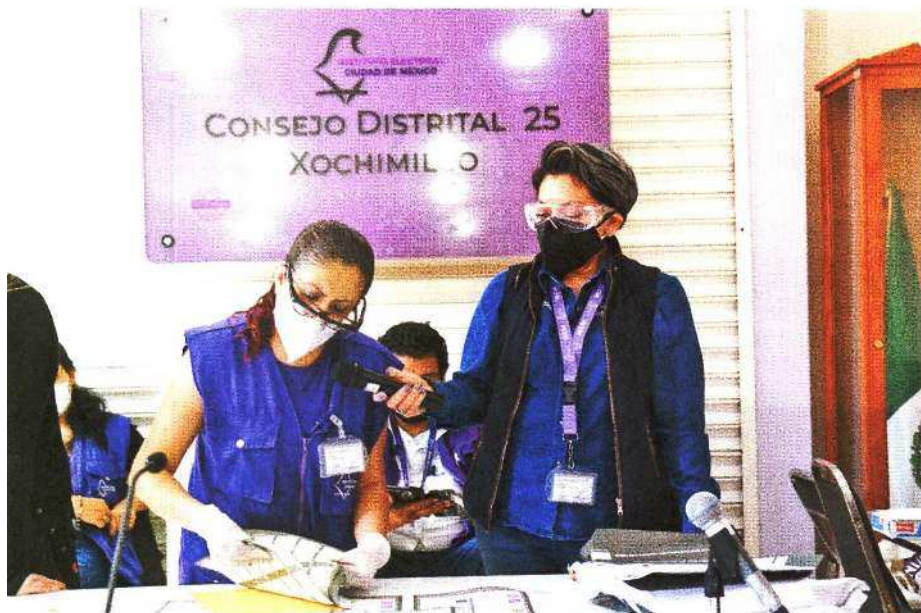
En las últimas 48 horas personal de las Juntas Distritales 19 y 25 del IECM realizó el conteo de votos sobre la elección de alcalde en Xochimilco, en el que se ratificó el triunfo de Morena.