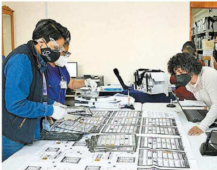
Diferencia mínima en el recuento de votos.

A. MARTÍNEZ Y F. DAMIÁN CIUDAD DE MÉXICO