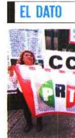
Manifestantes se instalaron en un plantón frente a la sede del CEN del PRI, el cual duró una semana.

todo el Comité Ejecutivo, se dé paso a esta comisión de transición, se convoque con fechas pactadas a la Asamblea Nacional, que debe ser inmediatamente, y absolutamente democrática”, sostuvo el exgobernador oaxaqueño. ●