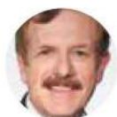
Juan Carlos Romero Hicks