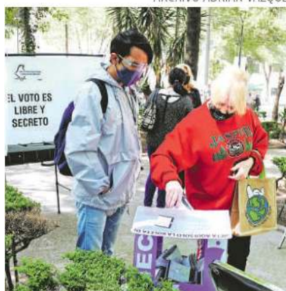
Esta es la segunda votación de 2021