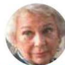
Olga Sánchez Cordero