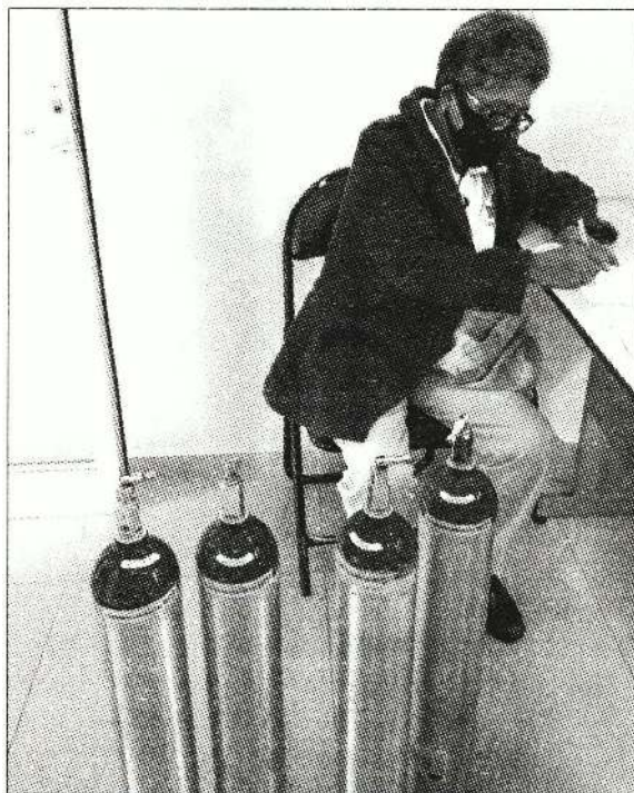
En apoyo a la economía familiar, el DIF Cuautitlán continúa el programa "Suministro de Oxígeno Medicinal" de forma gratuita para las personas enfermas por Covid-19.