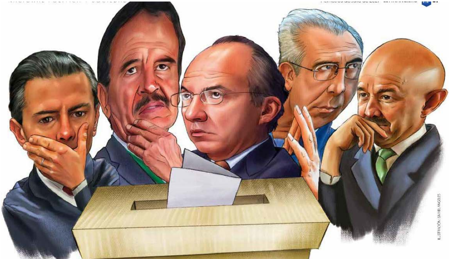
ILUSTRACIÓN: SAMUEL ANGELES