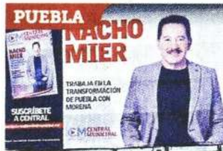
IGNACIO MIER , Coord. de diputados de Morena