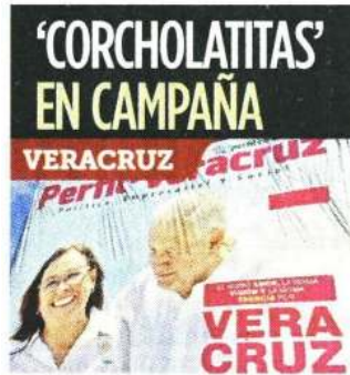
ROCÍO NAHLE , Secretaria de Energía