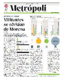
Gráfico: Rodolfo Gómez García