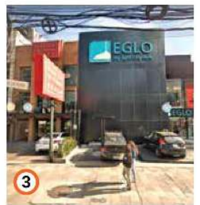
En Paseo de las Palmas 270 quieren 120 viviendas.