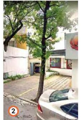
Una de las solicitudes es para Sierra Mojada 327.