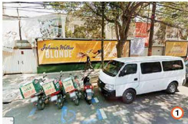
En Moliere 233, colonia Polanco, se pide uso de suelo habitacional con comercio, indica la Gaceta Oficial .

Todas las solicitudes han sido enviadas a la Comisión de Desarrollo e Infraestructura Urbana del Congreso de la Ciudad de México para su revisión y análisis, así como para su probable aval.